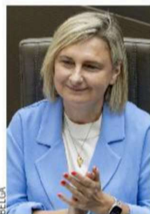
Hilde Crevits Vice-Première ministre flamande en charge des Affaires intérieures (CD&V)